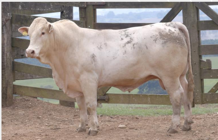
Data da imagem: 18/03/2026